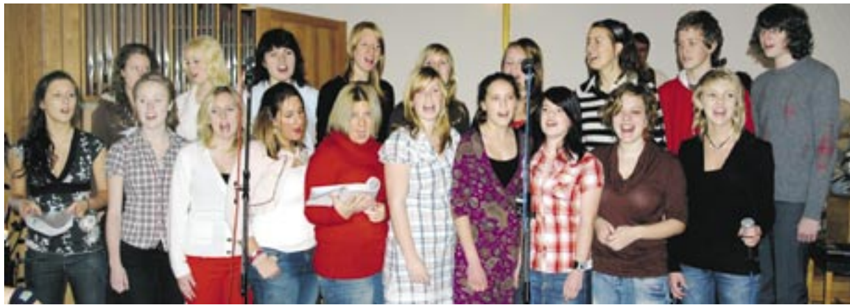
Ungdomskören Acquire från Skärblacka var nyligen på utlandsresa till Irland där de spred Lucicastämning och delade sin tro.