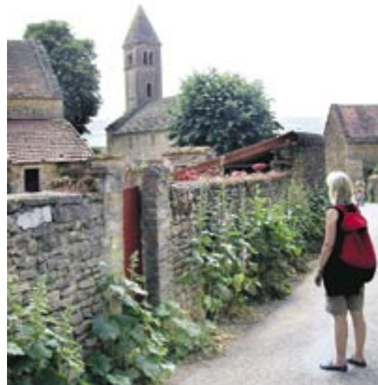
Många svenskar har besökt Taizé de senaste åren. Nu får vi också besök därifrån.

Vi hoppas att bröderna kommer att bli mottagna i församlingar och andra kristna organisationer i Stockholm med omnejd. Det blir ett tillfälle för kristna i Stockholm och övriga Sverige samt