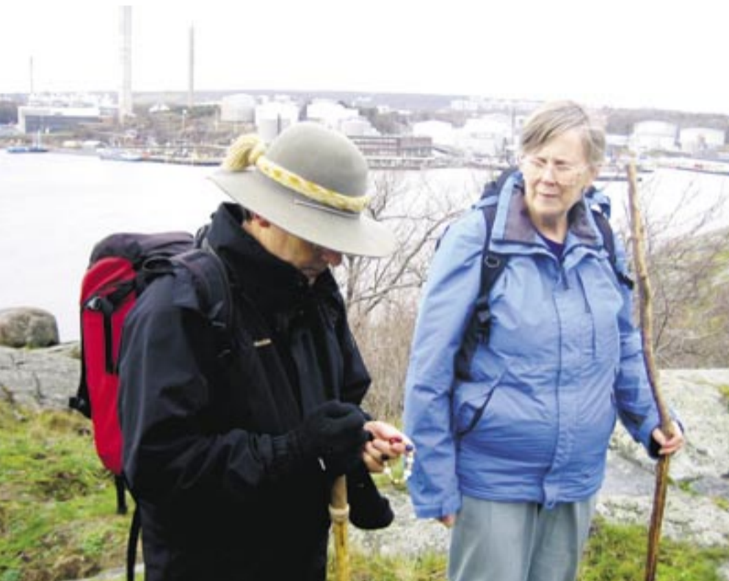
Meditation kring en av tystnadspärlorna på Sjöbergets topp.