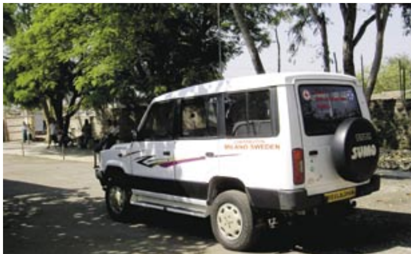
En av de två ambulerande kliniker (ambulanser), som församlingarna på småländska höglandet samlat in pengar till.