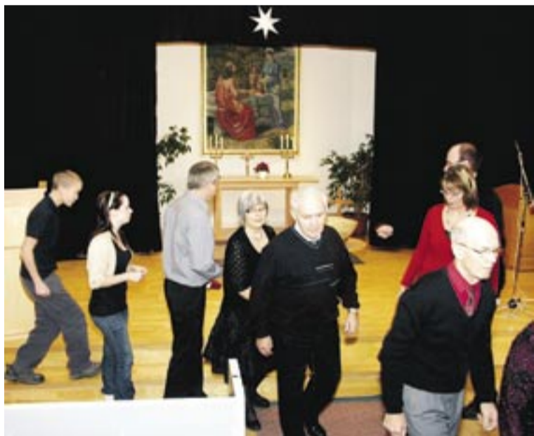
Offergång till yttre missionen i Vännäs missionskyrka. De svarta kulisserna är kvar sedan julspelet på julaftonen.