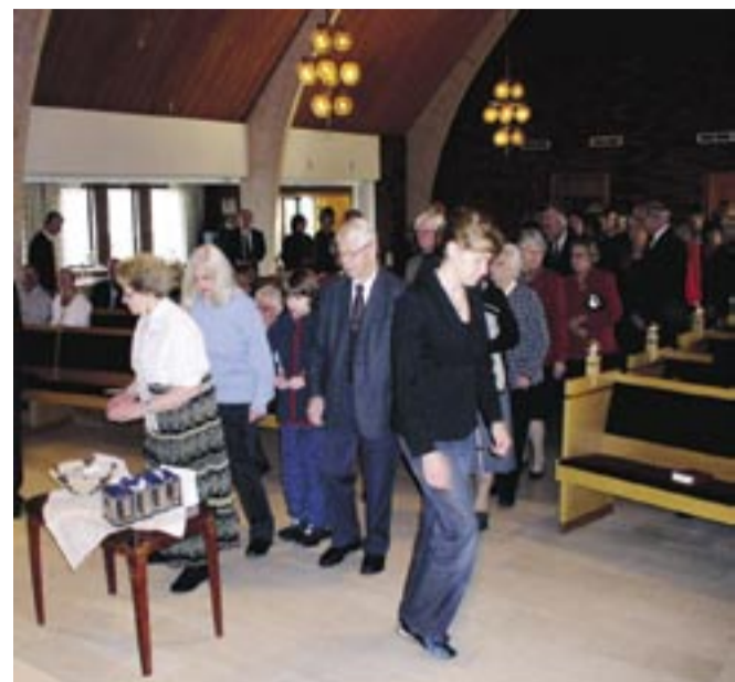
Offergång i Rosengårdskyrkan, Helsingborg.