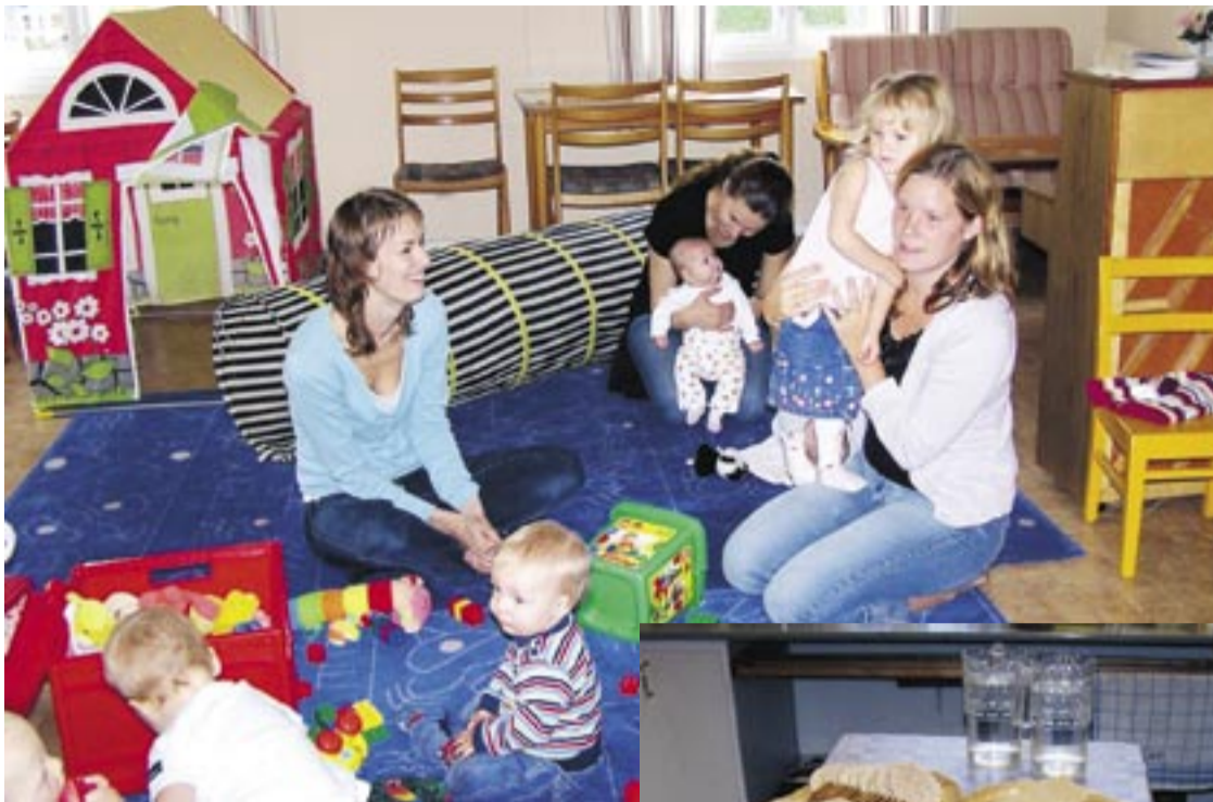
Familjgruppen i Tobo njuter av lite speciellt fika vid sina träffar – grönsaker i många olika färger – något som barnen gillar.