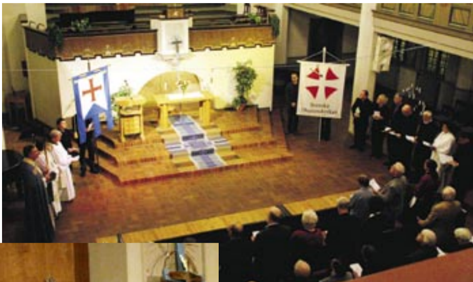
I Karlstad manifesterades överenskommelsen med en gemensam gudstjänst som började i Betlehemskyrkan med ordets gudstjänst. Sedan förflyttade sig församlingen till domkyrkan där man firade bordets gudstjänst, med nattvard.