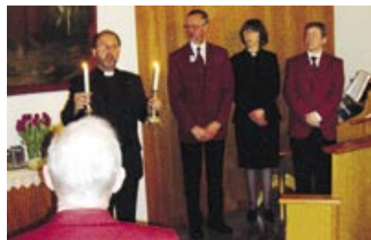
Ljuständning i Djurröd.

Alla barn som fanns med i gudstjänsten fick var sitt stearinljus, som de tände och satte på nattvardsbordet. När övriga ljus släcktes, stod de kvar som en bild av församlingens beredskap att fortsätta arbetet att sprida evangelium i bygden.