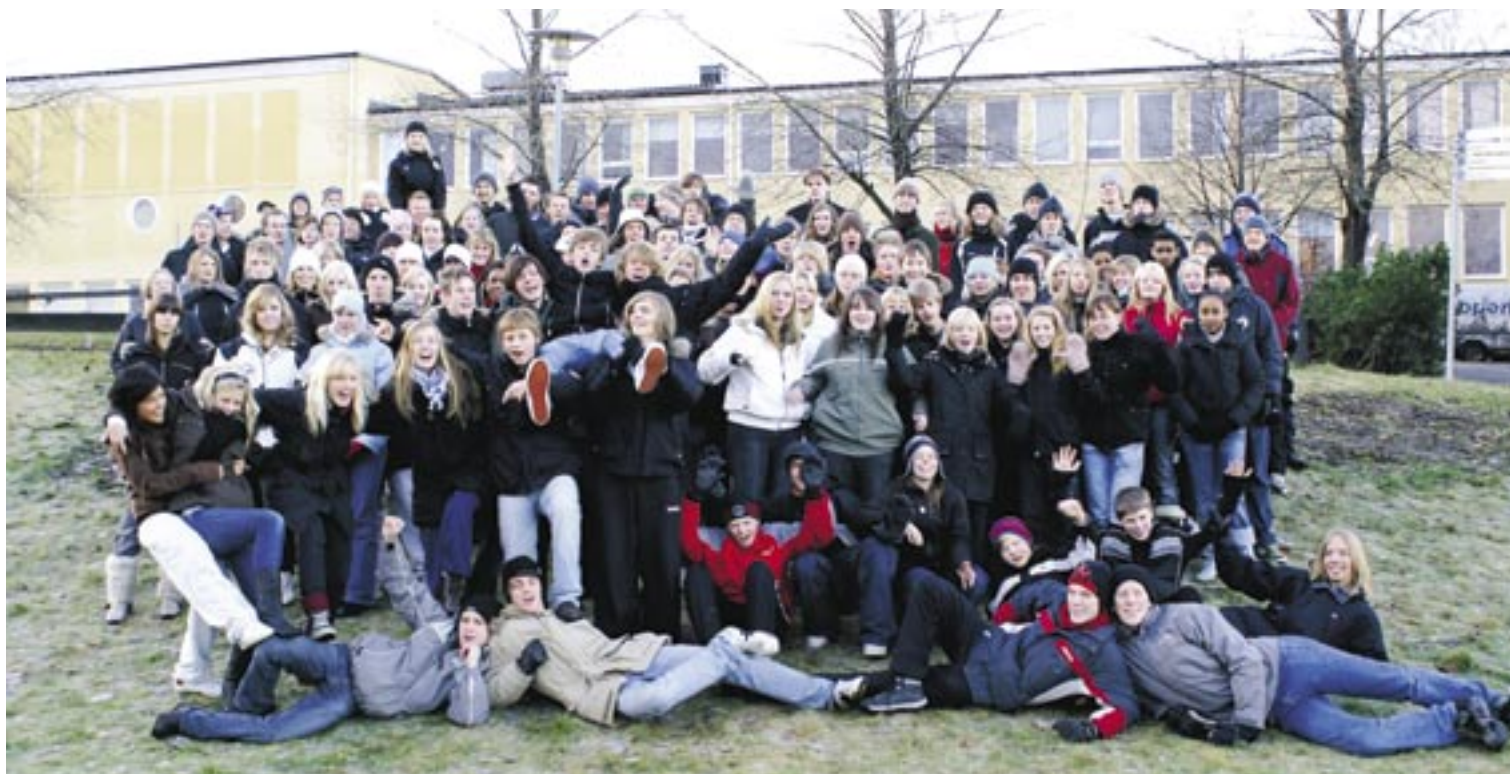
Massor av stjärnor.