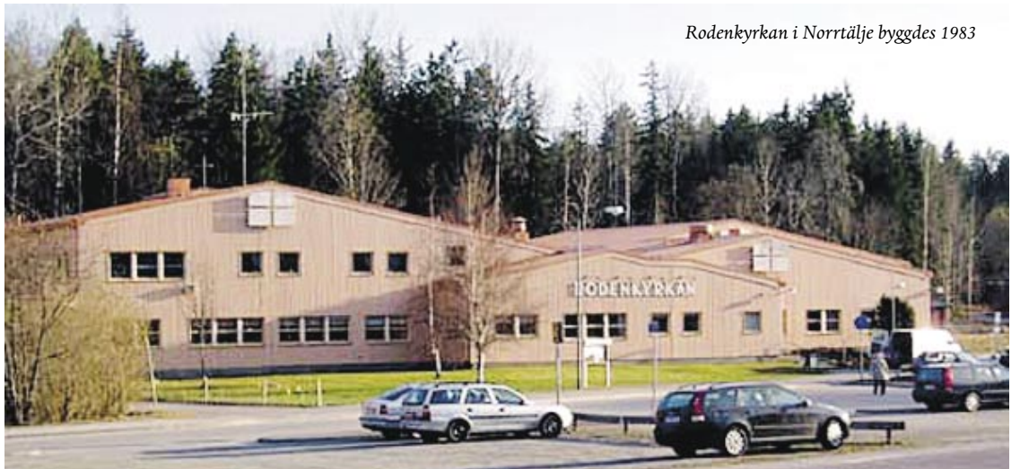
Rodenkyrkan i Norrtälje byggdes 1983