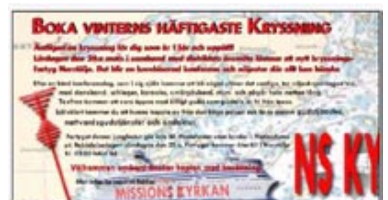
Följ med på en annorlunda kryssning!