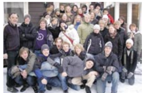
Ungdomsledare från tre distrikt samlade på Hjortsbergagården