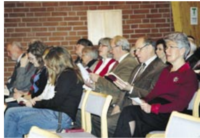
Högtidsgudstjänsten i Åbylunds kyrkan utanför Norrköping var välfylld av alla åldrar (Foto: Mats Gunnarsson)

jära uppdraget. På samma sätt ber vi och arbetar för att få en kärngrupp på varje ort som kan vara med och starta det nya. Till detta kommer behovet av flera församlingar som kan fungera som moderförsamlingar.