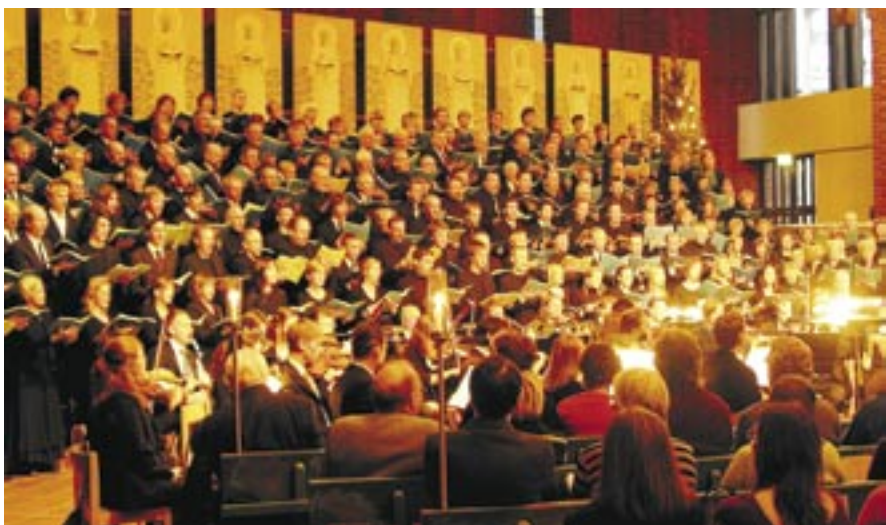
SMS och SBS fyller 80 respektive 95 år i år. Detta firas med en gemensam kurs och storkör i kyrkokonferensen.