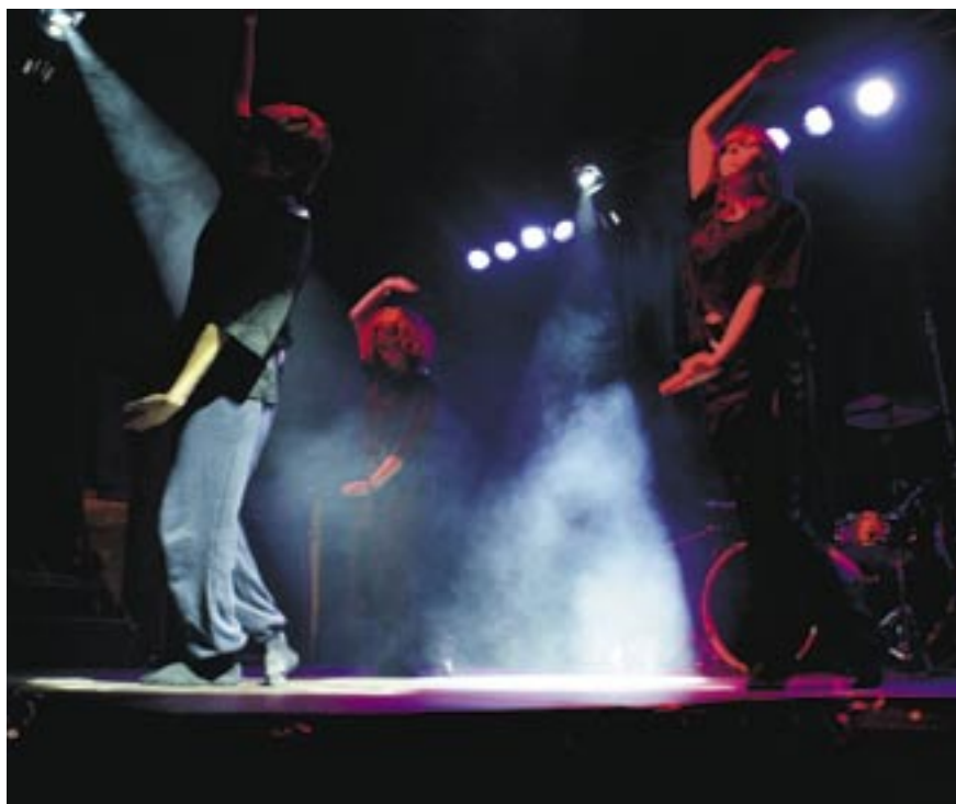
Två ser vi delar av Billie the Vision and the Dancers – multikulturen personifierad – och publiken. Till höger dansgruppen Zion från Köla.