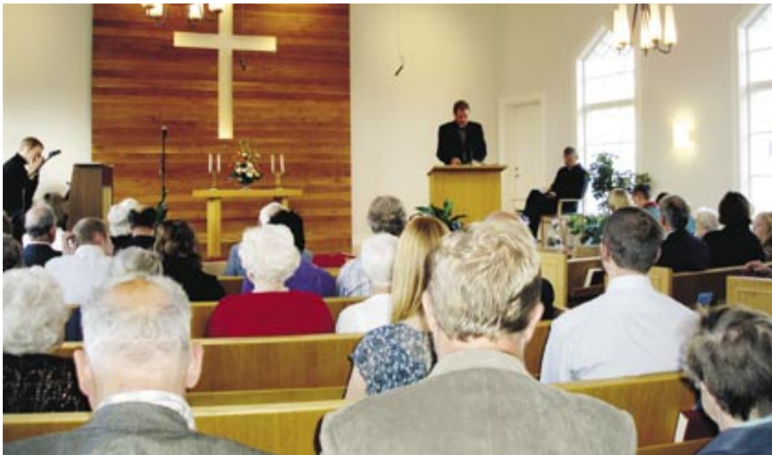
Alvesta missionskyrka återinvigdes under hösten 2006 efter en omfattande invändig renovering.