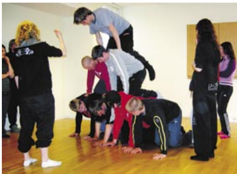
Teknikövningar under församlingarnas konfirmandläger i Hemavan.

Nådegåvorna, tro och vetenskap, kärlek och sånt, var några av de ämnen som behandlades. En av de saker som gjorde intryck på många var en annorlunda påskvandring, som man fick gå mestadels med ögonbindel. Här var det de andra