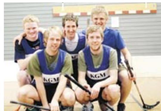
Björns pojkar – det vinnande laget i Rosendalshallen.