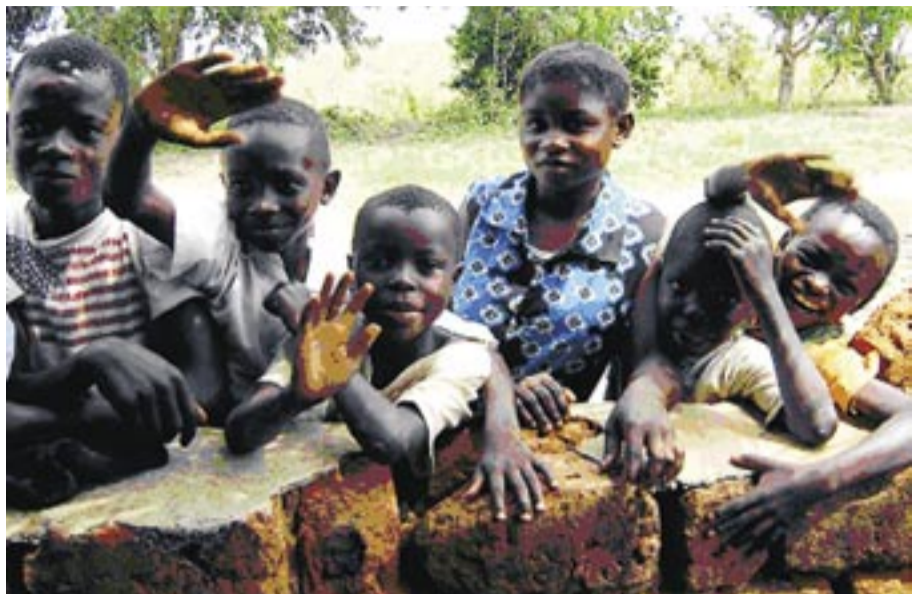
Delegationen från distriktet har varit på besök i vändistriktet Luozi.