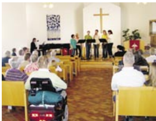
Sextetten Joyce sjöng vårsånger under vårfesten i Odalkyrkan.

En mycket välsmakande tvårätters middag stod på meny och mellan de båda rätterna blev det mera vårsånger som några av de yngre tjejerna övat in. Festen avslutades med en stund av eftertanke och andakt.