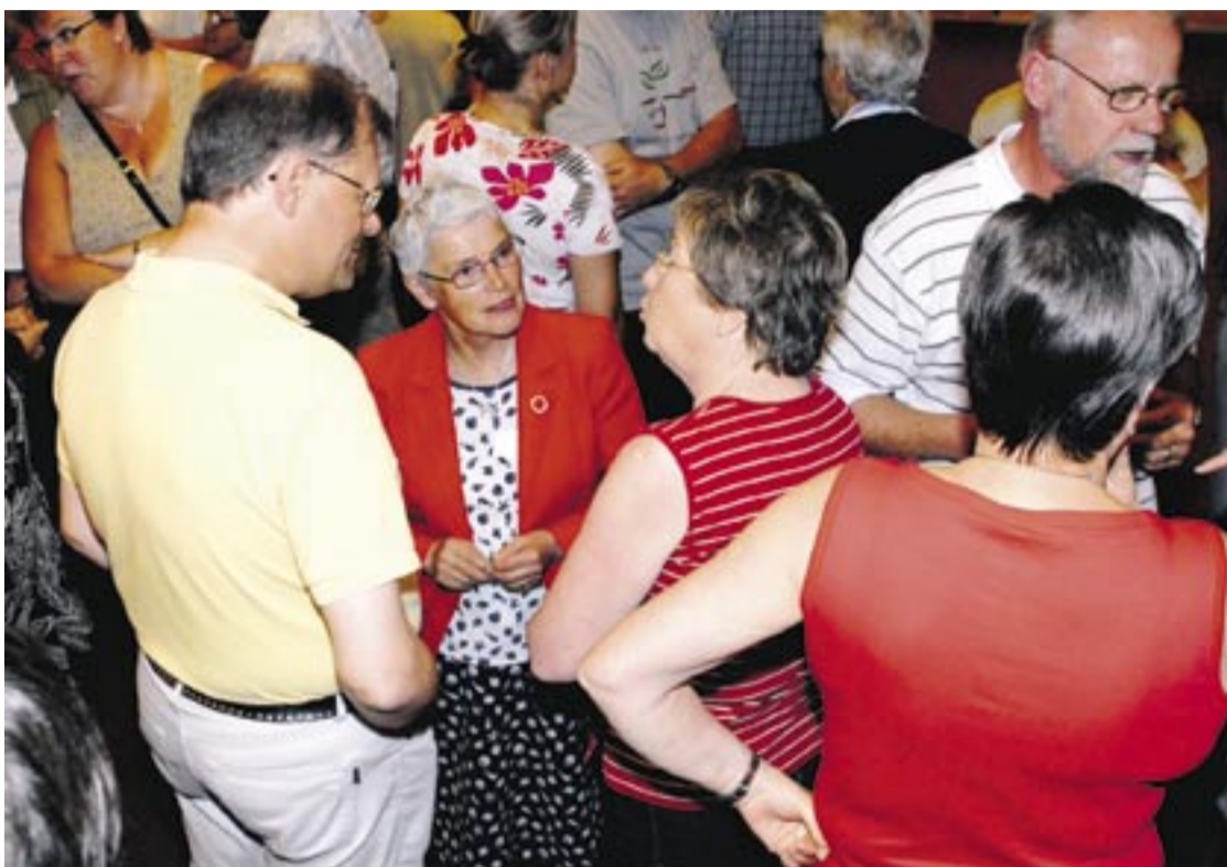
Konferensombud och andra intresserade kan välja bland ett stort utbud av seminarier.

– Den här trenden har kommit till Sverige och