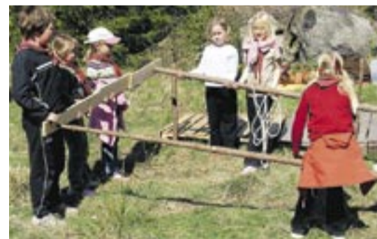
Koncentration på uppgiften under Dackefejden.

Dagen därefter var det Rimforsas tur att genomföra Budkavlekamp under temat "Jorden runt". Med världens länder som tema kunde segrare koras. Dagen inleddes med att två gästande