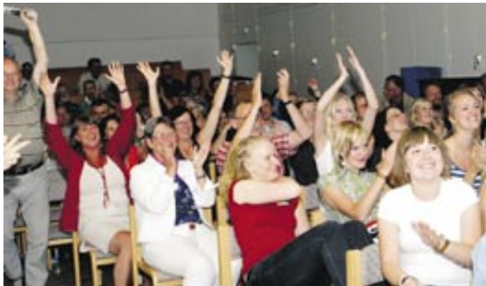
Kyrkokonferensen är mer än bara förhandlingar.