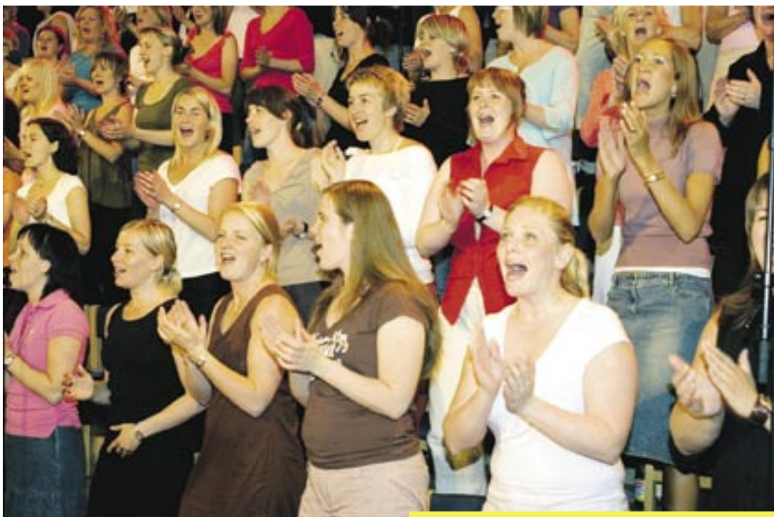
En stor jubileumskör kommer att medverka i kyrkokonferensen. Jubileet firas därför att Svenska Missionskyrkans Sångarförbund fyller 80 år.

Blandningen av stilar och uttryck är viktigt, både vad gäller körens repertoar och för de gemensamma sångerna i gudstjänsterna.