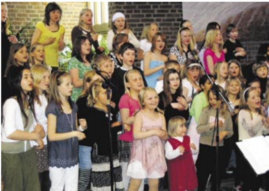
Barnsångarlägrets deltagare i full aktion.