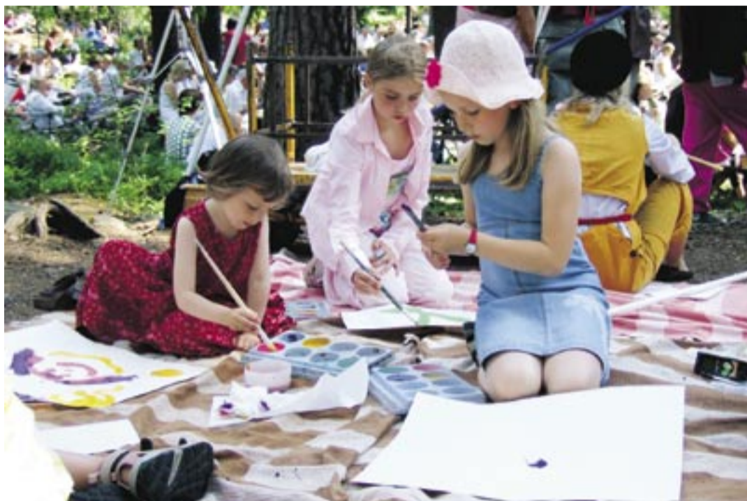
Kyrkokonferensen är en mötesplats för alla åldrar. Barnen har sin egen mötesplats och konferens.

Några trevliga försommardagar i Stockholm