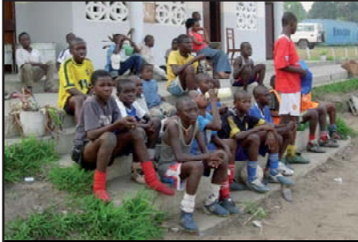
Förebygger framtida konflikter

10. Fotbollsprojektet Gothia Cup engagerar ungefär 400 barn och ungdomar i huvudstaden Brazzaville. De kommer från olika stadsdelar och olika folkgrupper, men här får de lära sig kamratskap och laganda – trots de många olikheter som finns. Efter kriget såg man ett behov av att sammanföra barn med olika bakgrund, för att förebygga framtida konflikter.