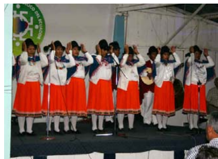
Oyacachi indianer vid Förbunds kyrkans 60-årsjubileum i Ecuador

Liksom tidigare år har vår systerkyrka HCC under fastetiden verkligen fastat och bett för det missionsarbete de är involverade i, däribland Sverige. För femte året i