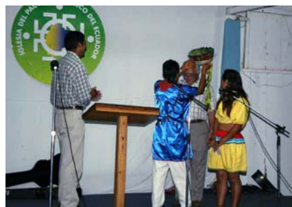
Cofan-indianer medverkar och "kröner" avgående missionsföreståndaren till hövding.

rad har man även sänt en gåva till pionjärbetet i Sverige. Vi behöver utbytet med systerkyrkorna och tar i ödmjukhet emot det stöd, personellt och ekonomiskt, som systerkyrkorna ger oss och vi omsluter dem i våra förböner..