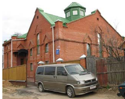
Kyrkan i Klin har byggts med stort stöd från Alingsås

Flera missionsförsamlingar har gjort stora insatser i Ryssland och för närvarande finns åtminstone tre väl etablerade vänförsamlingar, utöver Klin även Moskva (Gol-gataförsamlingen, som man från Kungälv, Stenungsund, Surte och