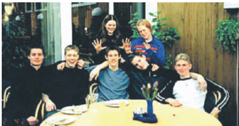
Vårens tonårsweekend Kontakt arrangeras i Helsingborg 26-28 mars.

Välkomna till innebandy-DM 2004! Betelkyrkans Ungdom i Höör