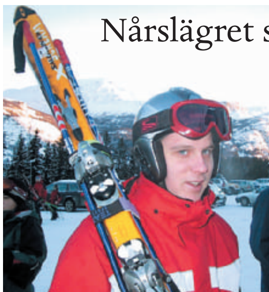
145 kronor i snitt per deltagare samlades in på distriktets nyårsläger i Gol.

Vår systerkyrka i Indien har inspirerat oss i Missionskyrkan det senaste halvåret med gåvor till pionjärbete i Färjestaden, 20 000 kronor i jubileumsgåva och 18 500 i ny gåva senare i höstas.