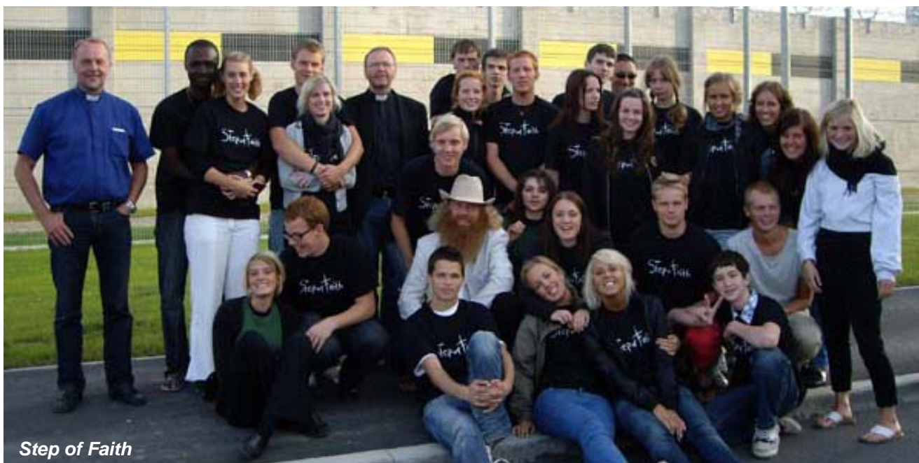
Step of Faith

Allt detta och andra utbyten betyder mycket för dem som får möjlighet till det, men också för församlingarna i Sverige och systerkyrkorna i andra länder. Vi är en kyrka och vi får samverka i Guds mission.