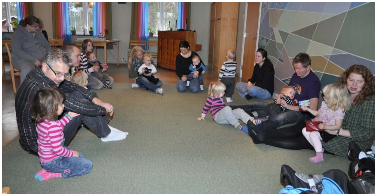
Föräldrar och barn sjunger tillsammans.