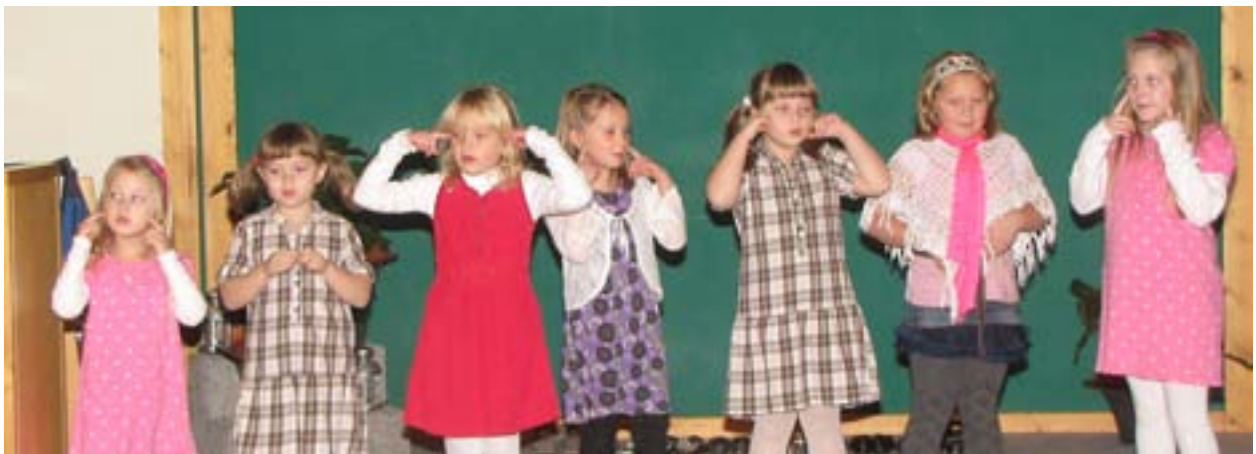
Barnkören Glädjefnatt har redan slutat sin termin