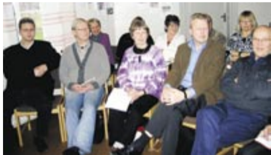
Några av deltagarna som återvände hem med nya perspektiv på olika sätt att inbjuda till och att fira gudstjänst.

Barnen tillsammans med sina ledare har under höstterminen och halva vårterminen övat in en bejublad musikal: Blommor och skratt av Jakob Skarrie. Man arbetade intensivt med både byg-