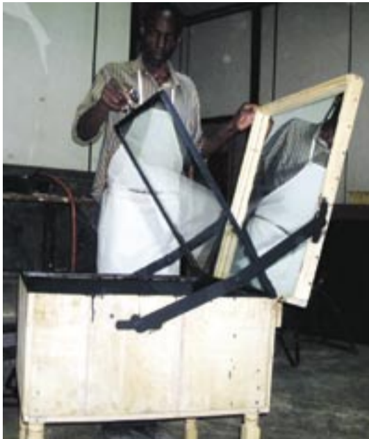
Produktion av energispisar i Uganda.

Där trodde jag att det hela slutade och att jag aldrig mera skulle höra av Data. När det gått ca en månad kom ett mail med frågor om konstruktion