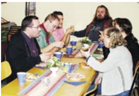
Fikapaus under ledarkursen.

Varför en lokal kurs? Anledningen till att Ledarguiden kom att bli en lokal kurs i Fellingsbro är att den just här fyllde ett grundläggande behov samt att det är enklare att flytta 1-2 personer som håller i