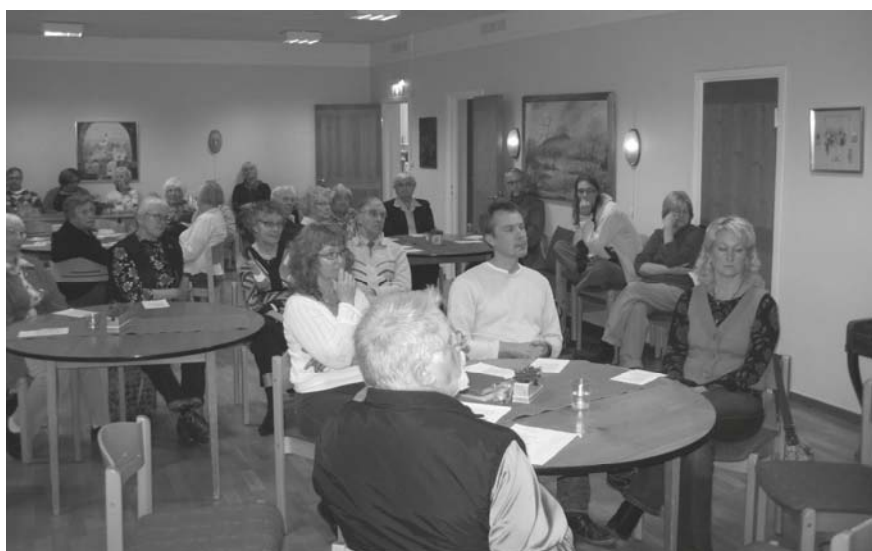
Distriktsöndag i Östersund

Under höstens fyra Distriktslördagar har det inbjudits till Idésamtal utifrån ämnet