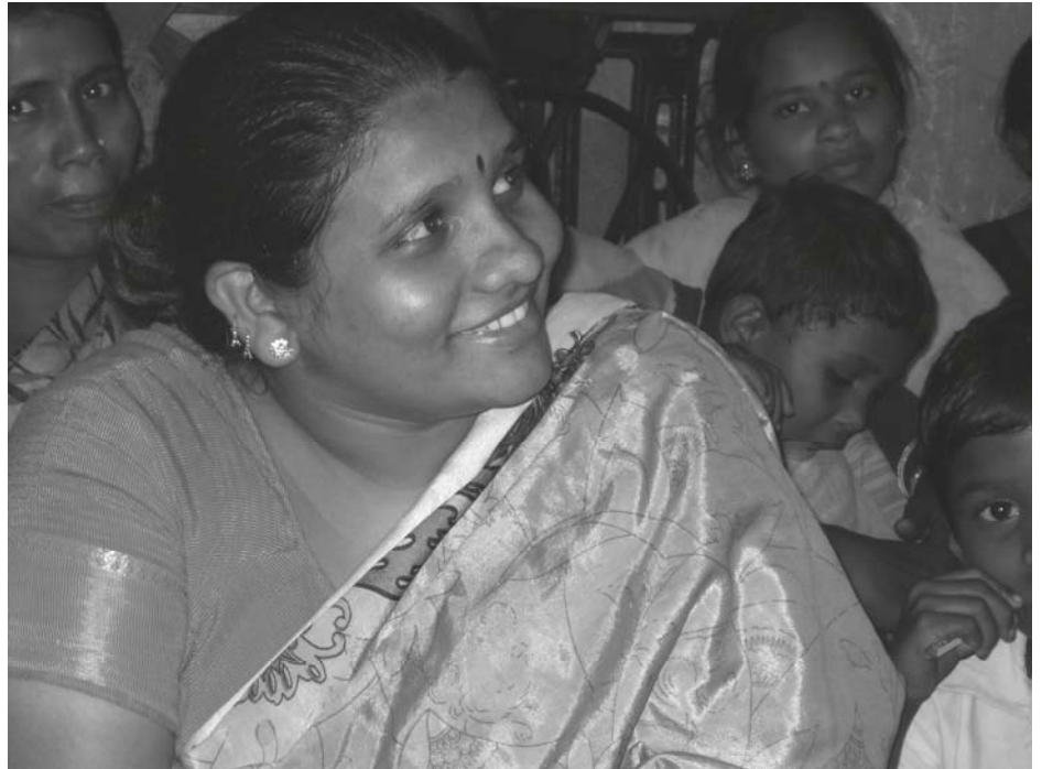
En stolt mamma, i projektet som stöder kvinnor och barn som tvingas försörja sig på att leta bland sopor.

derbart sätt har fört samman det sociala/diakonala engagemanget med den personliga evangelisationen. HCC är en kyrka som växer kraftigt. Jag besökte Indien för 19 år sedan. Då hade kyrkan ca 10 församlingar och ca 1000 medlemmar. Nu har man 109 församlingar med totalt ca 14000 medlemmar. Om vi hade varit i Indien en längre tid så hade vi säkert sett saker vi ställt oss frågande inför. Jag inser att vår systerkyrka