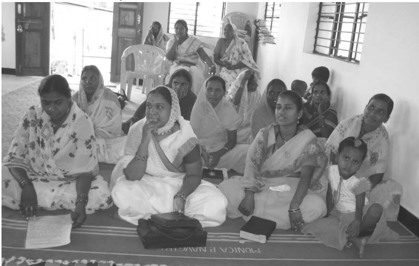
Kvinnor som bildat en självhjälpgrupp i en församling. De samlar regelbundet in pengar för att skapa en ekonomisk trygghet och möjlighet att låna pengar.