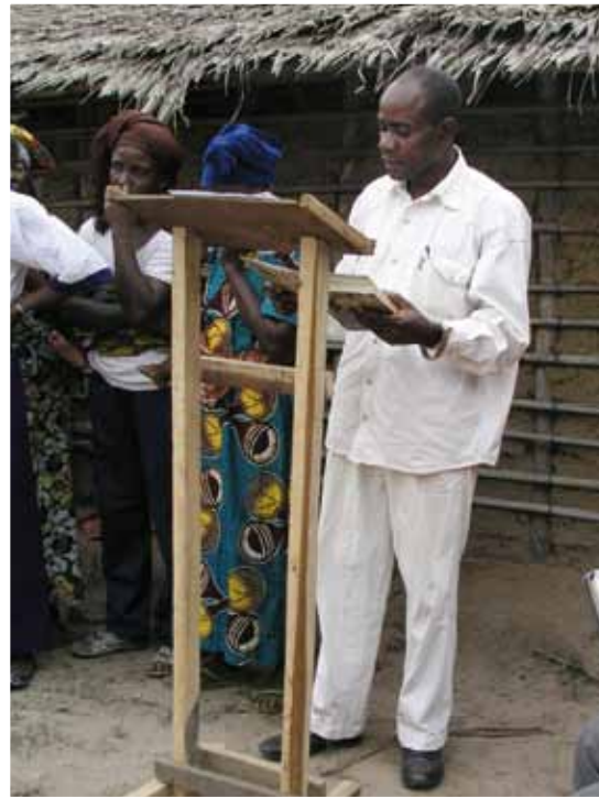
Evangelisation och församlingsutveckling är en del av det arbete som EEC bedriver i Kongo-Brazzaville.

Communauté des Eglises Baptistes Unies (CEBU) har cirka 30 000 medlemmar, 70 lokalförsamlingar och ett stort antal utposter. Förutom evangelisation, församlingsplantering, barn-, kvinno- och ungdomsarbete bedriver CEBU