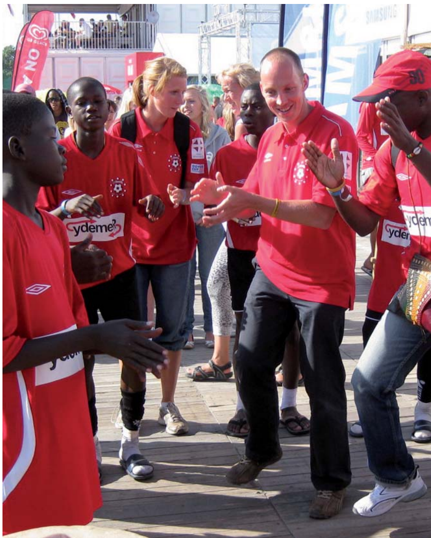
Dans vid kongotältet på Heden i Göteborg i samband med Gothia Cup.