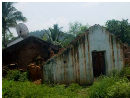
Ett av många förstörda hus.

Under sensommaren 2008 bröt det ut förföljelse mot kristna i delstaten Orissa i Indien. Många dödades och misshandlades och tusentals kristna familjers hem och kyrkor förstördes. Tiotusentals människor drevs på flykt. Attackerna planerades och genomfördes av fundamentalistiska hindugrupper.