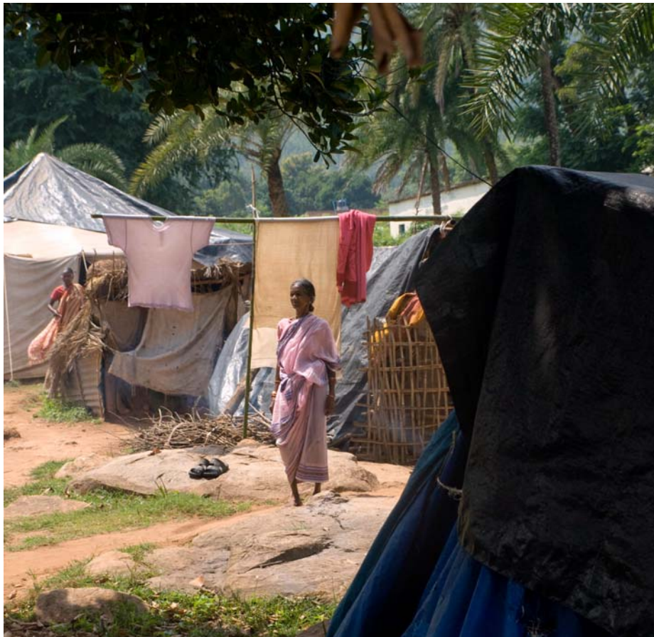
Tusentals människor lever fortfarande i flyktingläger.

Men fortfarande lever tusentals människor i flyktinglägren. Delvis har de inga hem att återvända till