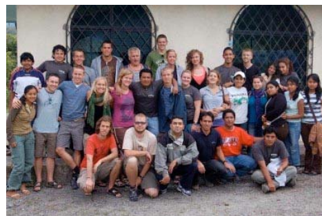
Apg29 i Ecuador september 2009

Be för deltagare och ledare för de båda skolorna. Det blir en särskild utmaning att starta upp en skola i Indien, där deltagarna på olika sätt kommer att få inblick i kyrkans arbete i det indiska samhället.