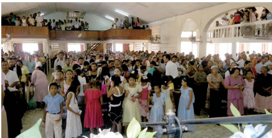
Högtidsgudstjänst på födelsedagen söndag 14 mars i en av Moravakyrkans arton församlingar i kuststaden Puerto Cabezas.