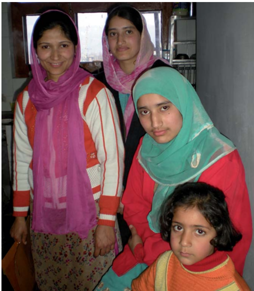
HCC arbetar för att unga kvinnor i norra Indien ska få möjlighet till utbildning och därmed en bättre framtid.

Under fastetiden har vi i Missionskyrkan särskilt uppmanat våra församlingar till bön och fasta för Svenska Missionskyrkan och för de frågor som är aktuella för oss som enskilda och som kyrka. Det handlar om vår kyrkokonferens och den nya kyrka vi vill forma tillsammans med baptister och metodister. När vi tänker på kyrkan och