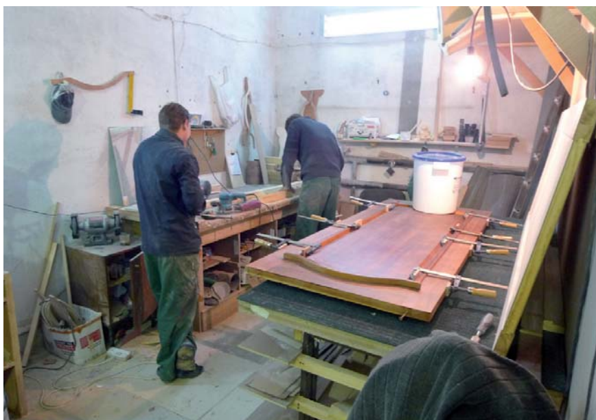
Litet snickeri i Asbest som ger utkomst åt flera tidigare missbrukare.

nya vänner, ny familj mm. Församlingar uppmuntrar de nyfrälsta med entreprenörsanda att starta egna företag och att de sedan anställer fler tidigare missbrukare. Men för att bli duktiga som affärsmän, fabrikanter, arbetsgivare behöver de utbildning, stöd, mentorskap. Frågan till Missionskyrkan var: "Kan ni hjälpa dem