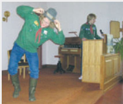
Samtidigt med Scoutfejden i Strömsund hade Västerbottens scouter Kämpalek i Vindeln.