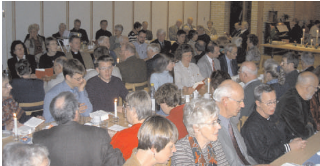
Trivsamt på framtidsfesten i Lund.

till Distriktsexpeditionen Södra Götalands distrikt av SMF 0451-146 22, fax 0451-850 83, e-post marie.bertilsson@missionskyrkan.se senast 14 november.