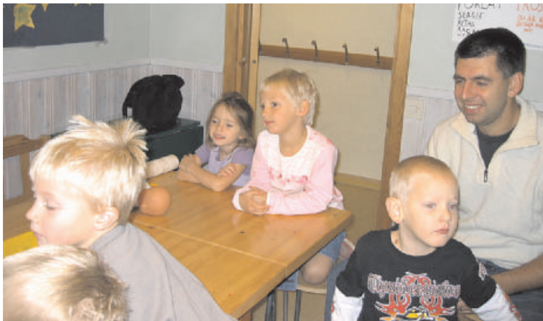
Koncentration i söndagsskolan i Mölnlycke missionskyrka.

Ordet Och Omsorgen möts i bönen och överlåtelser till Jesus Kristus. Tillsammans med Honom bjuds vi att gå Ordets Och Omsorgens väg.