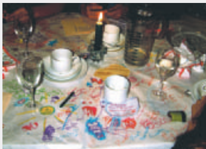
Drömmar klottrades ner på duken.